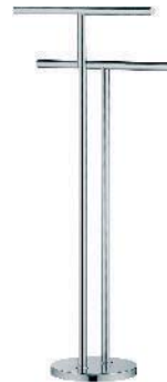
W4938 Piantana Standing column Serveurs Objektstange Columna