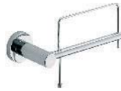
W4908 DX-SX Porta rotolo Paper holder Porte papier Papier Rollhalter Portarollo