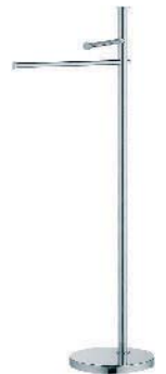
W4936 Piantana Standing column Serveurs Objektstange Columna