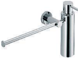
W4975 Porta salvietta e spandisapone per bidet Towel holder and soap dispenser Porte serviette et distributeur à savon Badtuchstange und Seifenspender Toallero bidet con dosificador