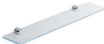
W4916 Mensola in vetro trasparente Clear glass shelf Console en verre transparent Tablar aus transparentem Glas Estante de cristal transparente