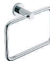
W4931 Anello porta salvietta Ring towel holder Anneau porte serviette Handtuchring Toallero de anilla